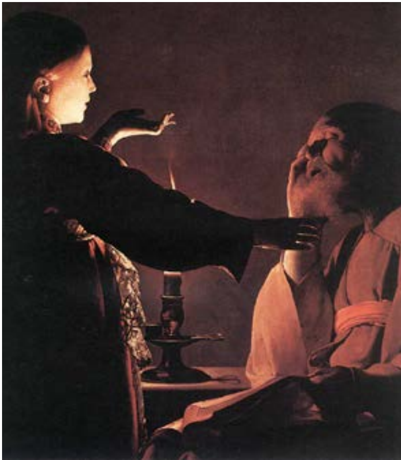
El sueño de san José. Georges de la Tour.