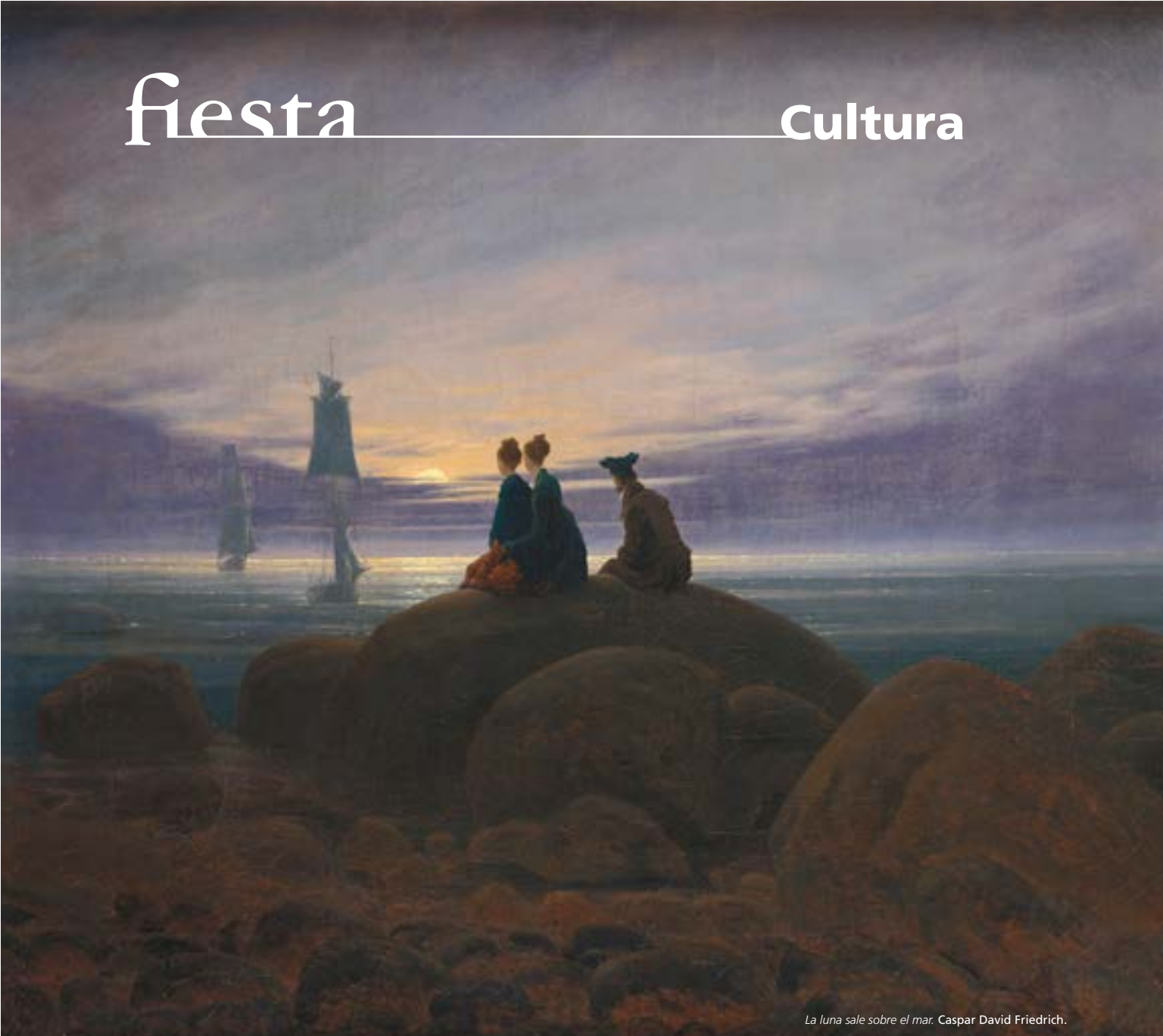
La luna sale sobre el mar Caspar David Friedrich.